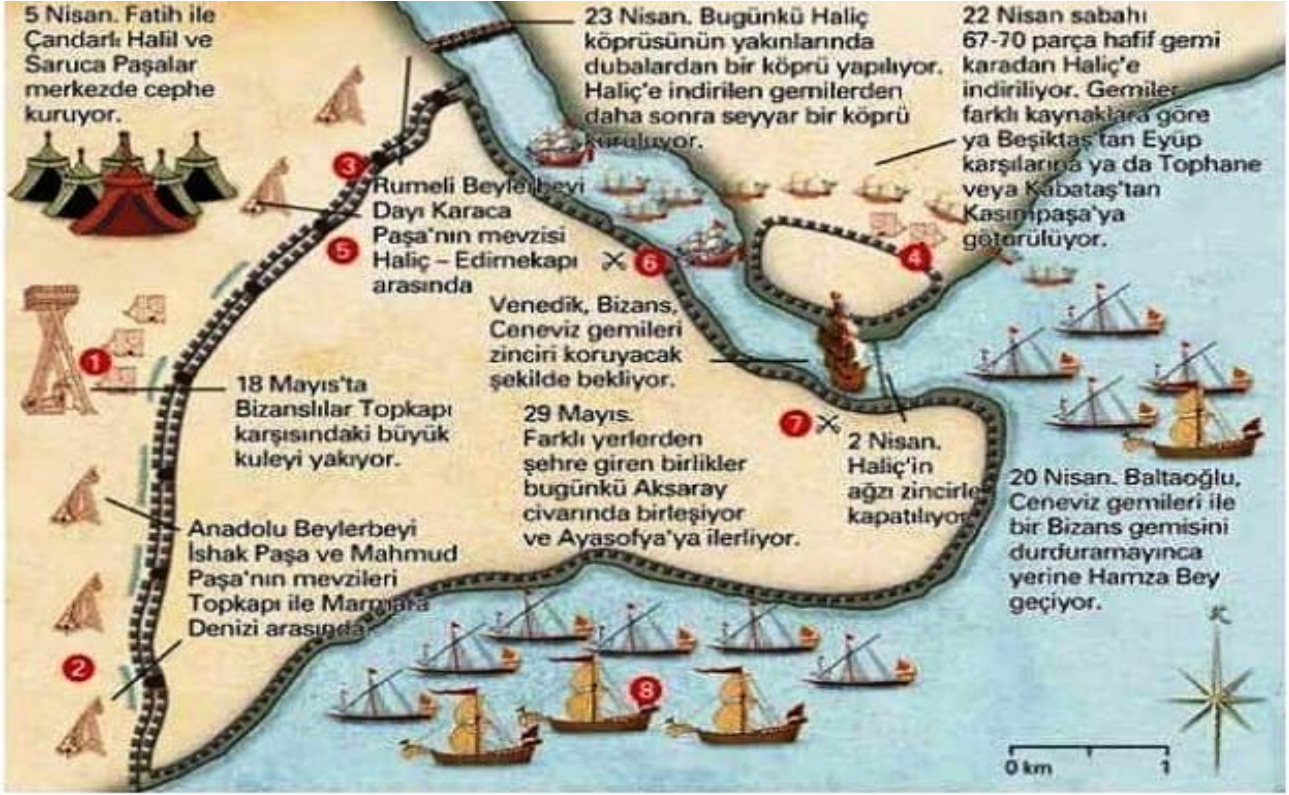
İstanbul'un Fetih Haritası